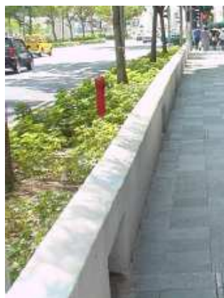
2. sz. ábra. Térképző elemként használt virágtartó és emelt szegélykö 4

Az úttest és járda közötti területen zöld felület is kialakítható, leginkább fákkal. Az alacsony cserjés növényzetben könnyen elrejtethők a robbanóanyagok, –eszközök, ezért telepítésüket jobb elkerülni.