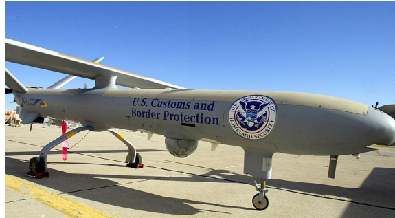
2.sz. ábra A „határőr” MQ-9 Reaper 637

ellenőrzésének megerősítésére. 636 Egy egység 3-3 robotrepülőgépből áll, akár 24 óras műveletekben is részt tudnak venni, hatótávolsága 500 km, 7,5 km-es magasságból éjjel-nappal jó minőségű képet tud közvetíteni.