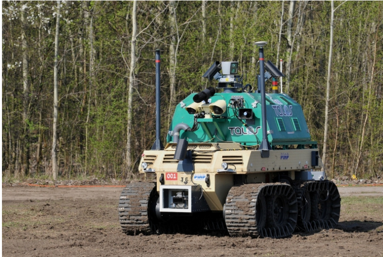
3.sz. ábra A TALOS rendszer megfigyelő járműve 638

A robotjármű-rendszerek megvásárlása azonban nem egyszerű feladat, erős eltökéltség és anyagi háttér szükséges hozzá. Véleményem szerint a rendszereket a tartósan külső határral rendelkező országok közösen- vagy a Frontex vásárolhatná meg, illetve lízingelhetné. Ez utóbbinak megfelelő jogszabályi alapot adhat a Frontex-rendelet tavalyi módosítása. 639