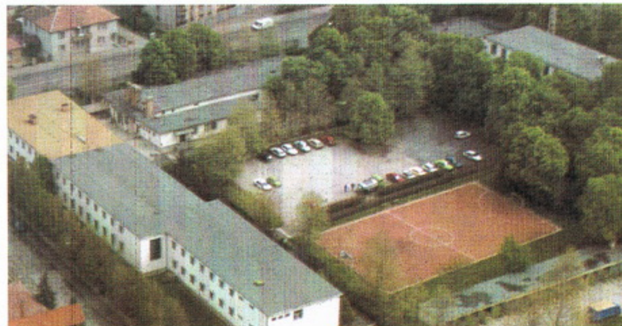
Az igazgatóság épülete Pécsen.

közös határszakaszon 199,913 km hosszúságban őrzi az államhatárt, amelyből 105,063 km a szárazföldi és 94,850 km a vízi határszakasz. A Somogy megyei államhatárszakasz 57,733 km, a Baranya megyei 142,180 km hosszú.