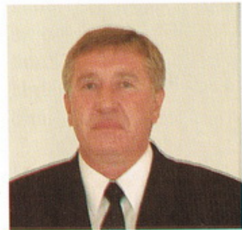
Dakos József határőr dandártábornok

1965-ben született Baktalórántházán. 1987-ben végzett a Kossuth Lajos Katonai Főiskola határőr parancsnoki szakán. 2003 óta tagja a Magyar Hadtudományi Társaság Határőr Szakosztályának. Érdeklődési területe a külső határ őrizetének elmélete és gyakorlata az Európai Unióban. Német nyelvből alapfokú állami nyelvvizsgával rendelkezik.